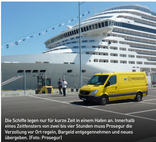
Die Schiffe legen nur für kurze Zeit in einem Hafen an. Innerhalb eines Zeitfensters von zwei bis vier Stunden muss Prosegur die Verzollung vor Ort regeln, Bargeld entgegennehmen und neues übergeben.

Betreiber von Kreuzfahrtschiffen haben einen hohen Bedarf an Bargeld. Denn Crewmitglieder erhalten ihre Heuer traditionell in bar. Außerdem soll in der Bordkasse Wechselgeld vorrätig sein. Hauptsächlich sind auf einem Kreuzfahrtschiff US-Dollar im Umlauf, aber auch Euro und andere Währungen werden benötigt. Die Deutsche Bank bietet Schiffsbetreibern die passende Lösung für ihr Bargeld-Handling. Der Kooperationspartner Prosegur organisiert dabei die Logistik – vom Transport bis zur Zollabfertigung.