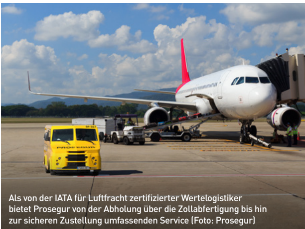
Als von der IATA für Luftfracht zertifizierter Wertelogistiker bietet Prosegur von der Abholung über die Zollabfertigung bis hin zur sicheren Zustellung umfassenden Service